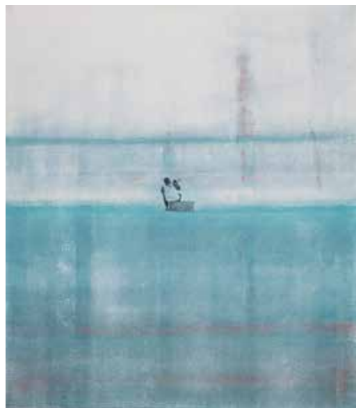
Blues Acryl auf Leinwand, 80 x 70 cm, 2013 EUR 4.200.-