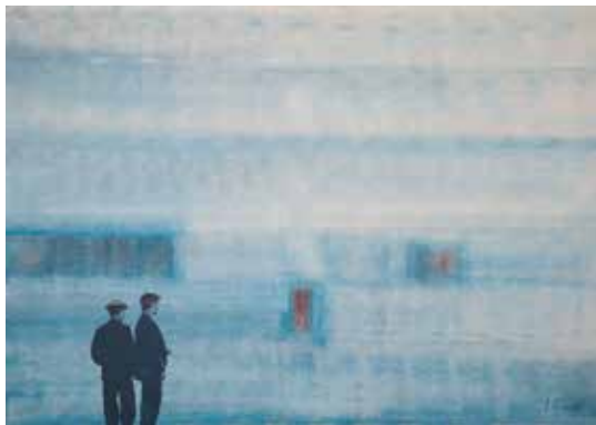
Mare Acryl auf Leinwand, 100 x 140 cm, 2012 EUR 7.400.-